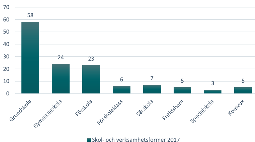
Diagram 2: Skol- och verksamhetsformer

Under både 2016 och 2017 har ett huvudsakligt fokus i ansökningarna varit på grundskolan, gymnasieskolan och förskolan. Nytt i 2017 års utlysning är att några få ansökningar också inriktas på den kommunala vuxenutbildningen, specialskolan och fritidshem (diagram 2).