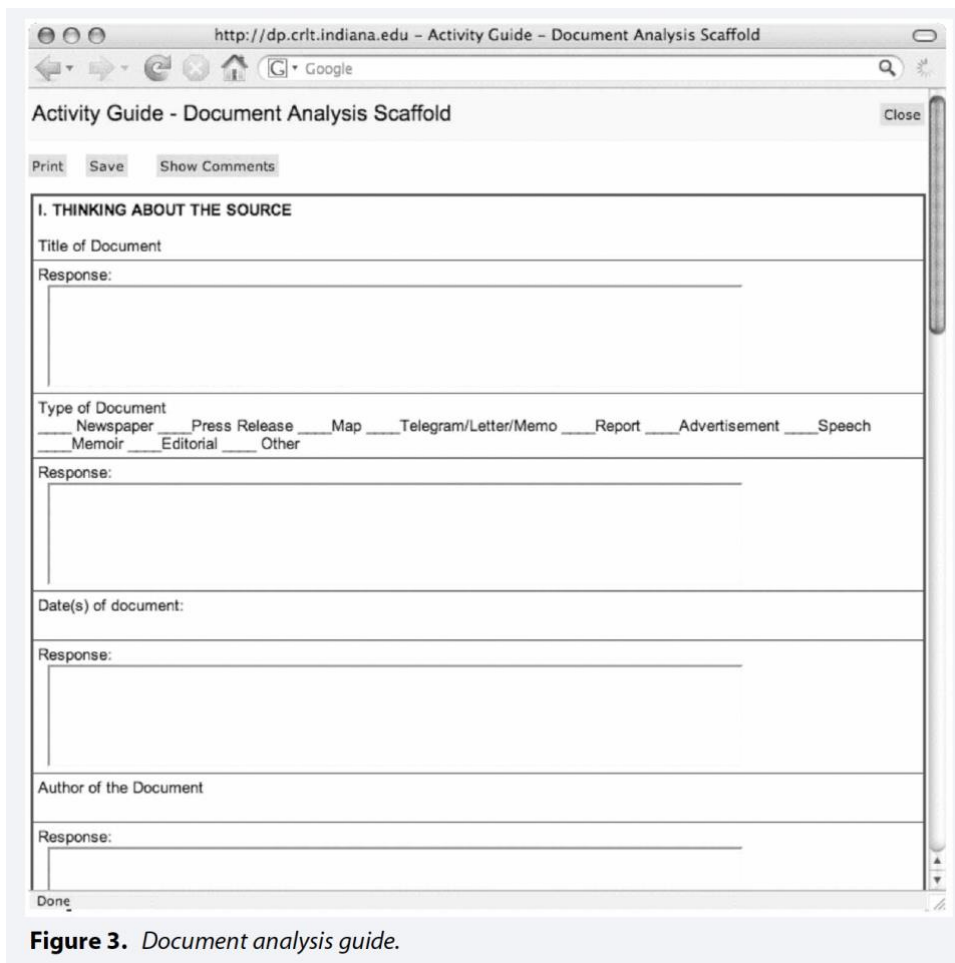
Figure 3. Document analysis guide.

De La Paz och kollegor (2022) har också studerat arbete med mallar som går att ladda ner fritt: https://www.researchgate.net/figure/IREAD-Scaffold-foldable_fig1_352931404